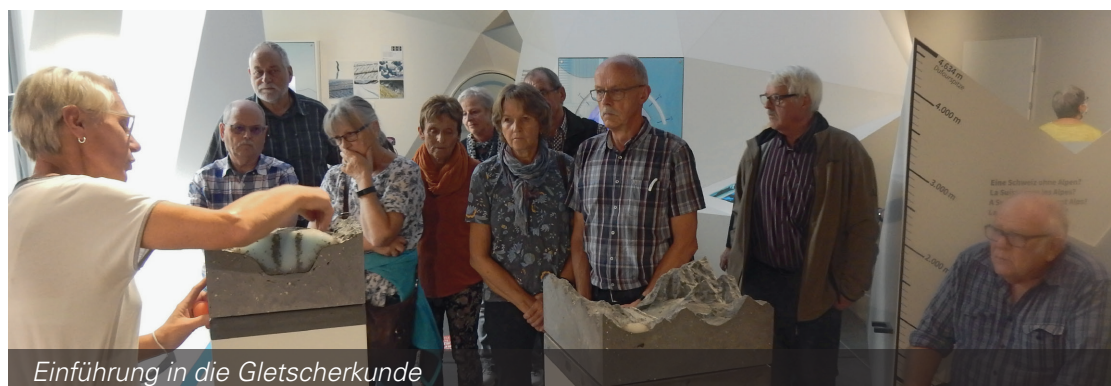
Einführung in die Gletscherkunde