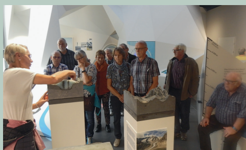
BE Vorstandsreisi 17