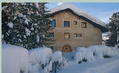
GR Jubiläums-GV 2021 19